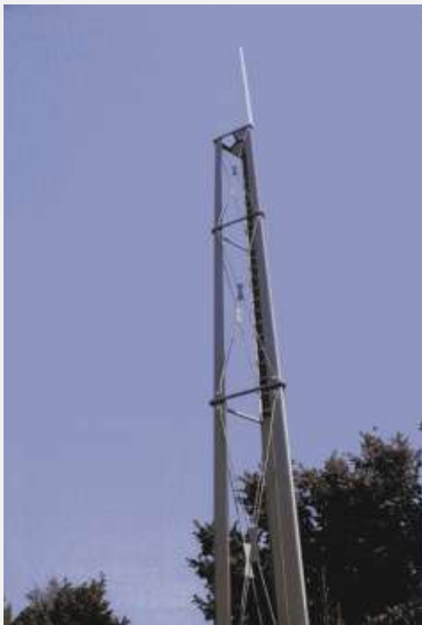
Zone Neutre Installazione di antenne su palo costituente arredo urbano