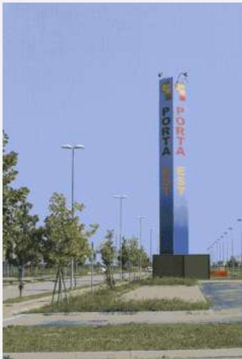
Zone Neutre Installazione di antenne su palo mimetizzato