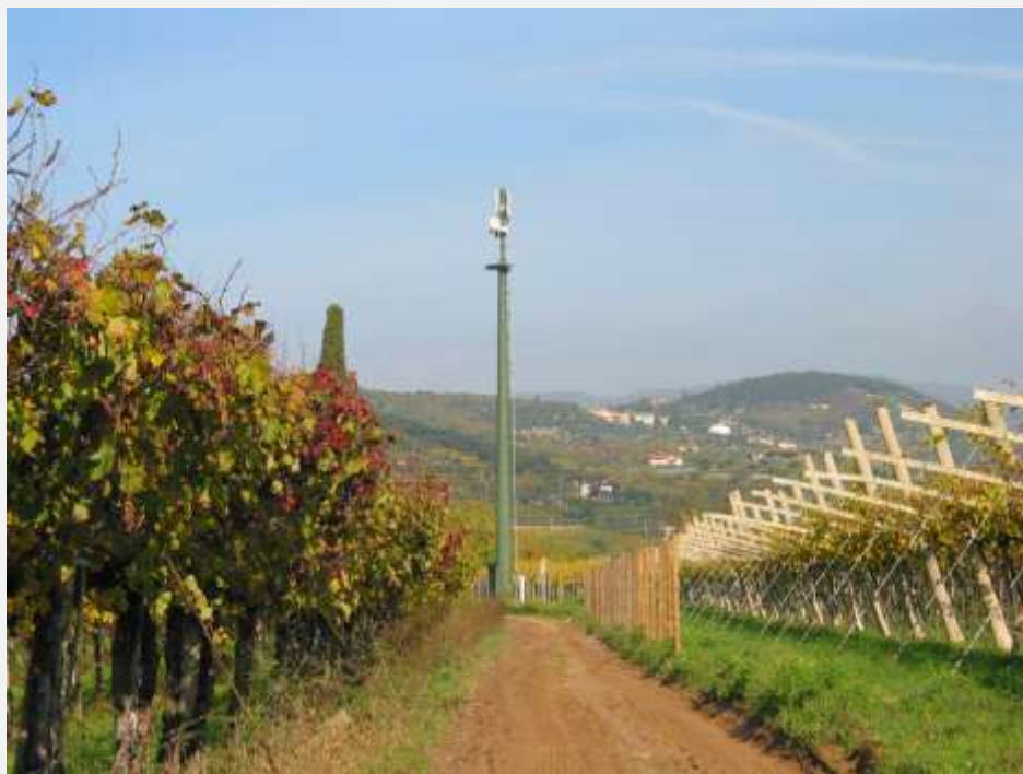
Zone Neutre Installazione di antenne su palo mimetizzato