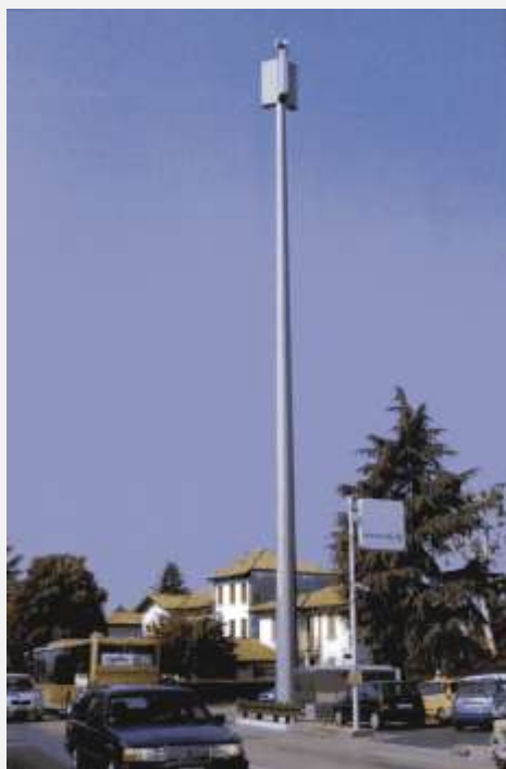
Zone Neutre Installazione di antenne su palo con elementi per la mimetizzazione