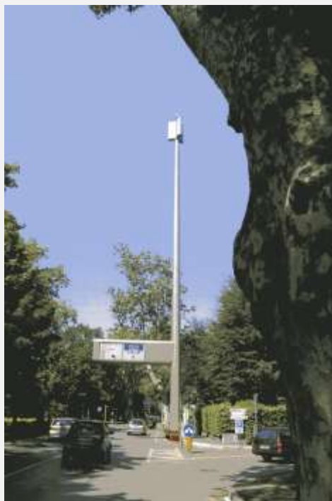
Zone Neutre Installazione di antenne su palo con elementi per la mimetizzazione