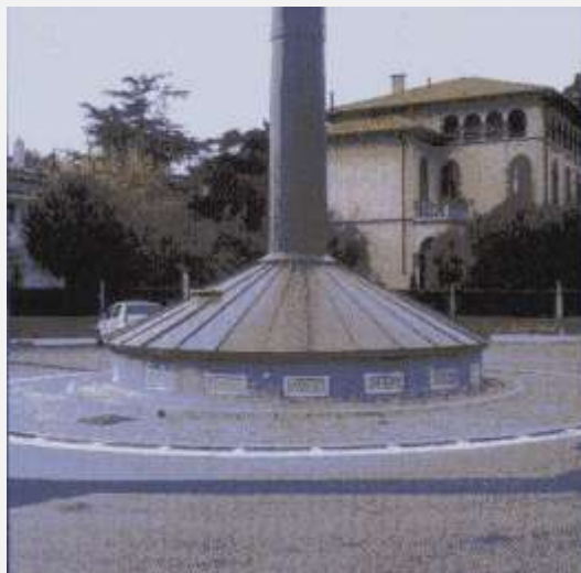
Zone Neutre Shelter mimetizzato