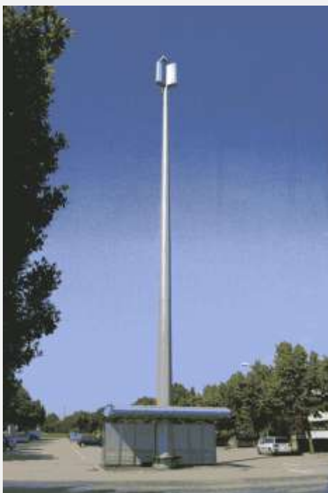
Zone Neutre Installazione di antenne su palo con elementi per la mimetizzazione