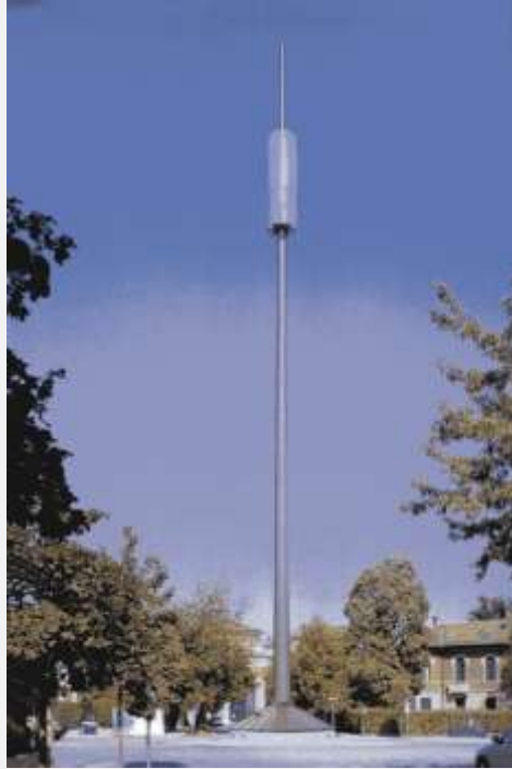
Zone Neutre Installazione di antenne su palo costituente arredo urbano