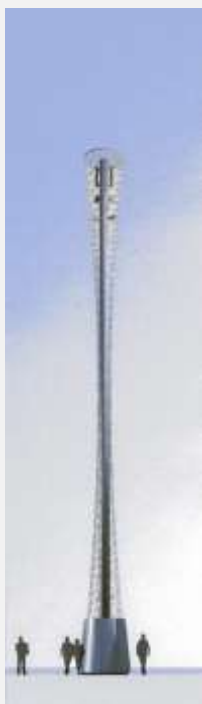
Zone Neutre Installazione di antenne su palo costituente arredo urbano