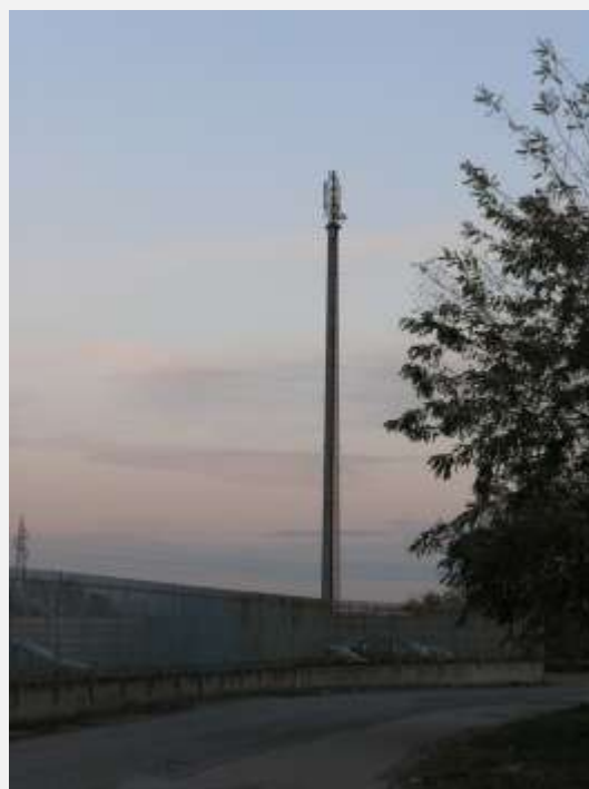
Zone Neutre Installazione di antenne su palo e co-siting